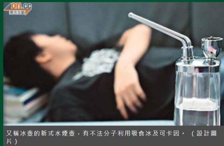
又稱冰壺的新式水煙壺，有不法分子利用吸食冰及可卡因。（設計圖片）