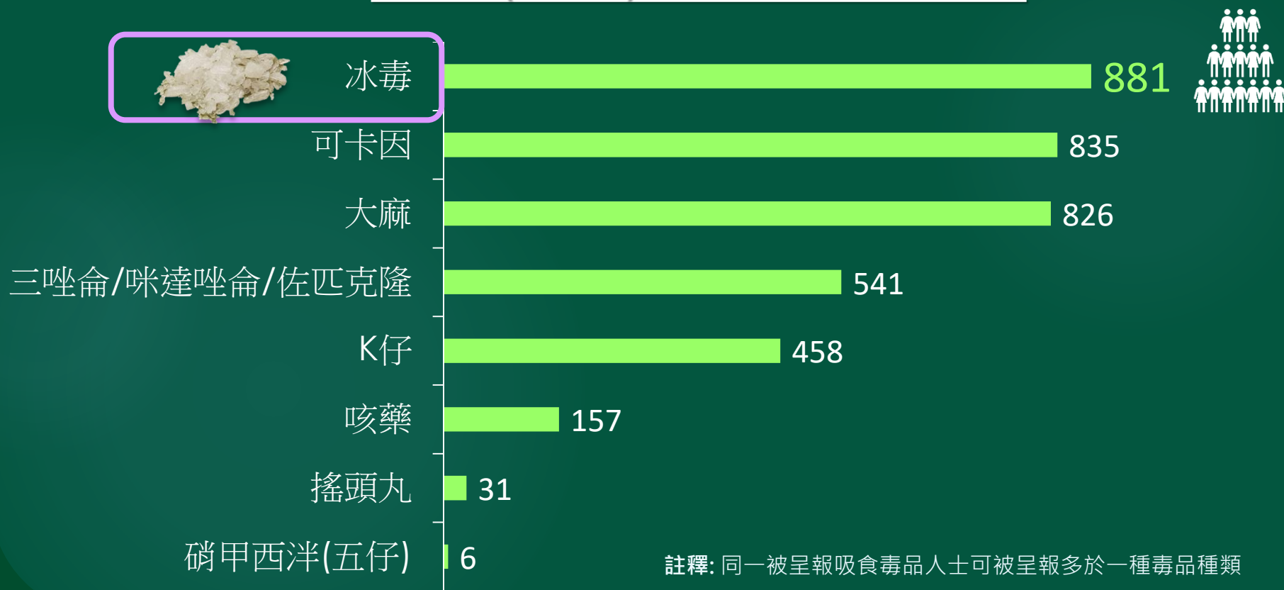
2021年(首三季) 被呈報整體的吸毒人數