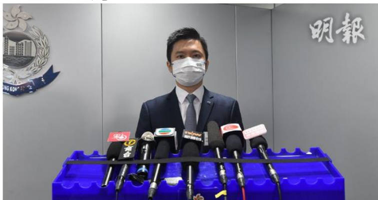
圖1-1-警方毒品調查科署理總督察陳熾輝交代反毒品行動情況。

毒品調查科聯同各大總區在8月15日至31日，進行一個代號為「捍衛者」的行動，共拘捕212男38女，年齡介乎14歲至80歲，被捕罪名包括 製毒、藏毒、販毒、經營毒窟、管有第一部毒藥、藏有吸食毒品工具，以及吸食或注射毒品 等，20名未成年被捕人士中，10人是學生。